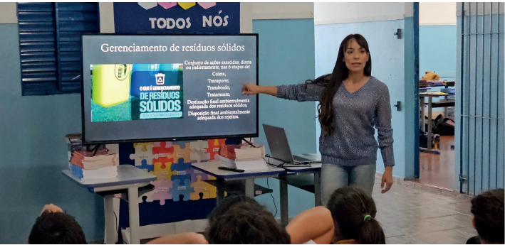
Educação Ambiental: semeando conhecimento e atitudes.

Ao longo do ano diversas árvores foram plantadas nos bairros e na área central da Cidade. Algumas espécies estão sendo substituídas por outras mais adequadas, sendo que todos os plantios e substituições são realizados pautados em estudos ambientais aprofundados, elaborados por profissionais especializados, com foco na sustentabilidade e na preservação ecológica do nosso Município.