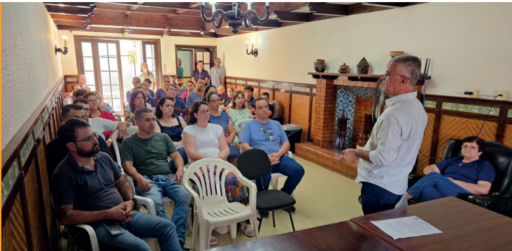
Reuniões periódicas dos líderes do Executivo Municipal com os secretários, diretores, assessores e servidores vêm assegurar o alinhamento de estratégias e o gerenciamento de demandas, buscando, com isso, uma execução eficiente dos serviços prestados à população.

Essas Secretarias são, portanto, a espinha dorsal da Administração Municipal, garantindo a eficiência, a legalidade e a sustentabilidade financeira de todas as políticas públicas.