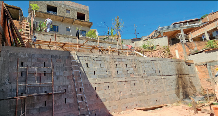
Muros de contenção foram construídos em diversos bairros da Cidade

O atendimento emergencial funciona 24 horas e pode ser acionado pelo telefone (35) 98428-9625 .