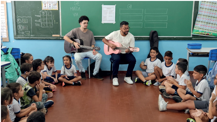
Aulas de musicalização