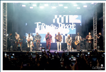
Turma do Pagode

A realização de grandes shows, gratuitos, voltados à população, em comemoração ao aniversário da Cidade marcou a retomada de uma festa linda, celebrativa, unindo shows de grande porte aos shows dos artistas locais, tão amados pela comunidade, fez com que a festa do dia da Cidade voltasse a ter o seu destaque no calendário de eventos, afinal há tempos os caxambuenses não tinham um presente como esse.